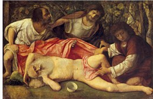
L'Ivresse de Noé