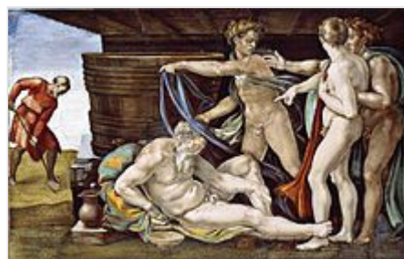
L'ivresse de Noé par Michel-Ange .

Cette scène fut représentée peu d'années auparavant (1508-1509) à Rome par Michel-Ange sur la voûte de la chapelle Sixtine . Mais la représentation de Bellini diffère de celle de Michel-Ange : la représentation semble ici profane et naturaliste contrairement aux caractères antiquisant de la fresque du Vatican.